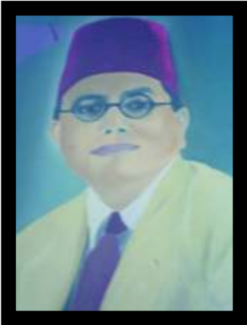
Sir Razik Fareed

අද ජීවත්වන අතැම් ජිරිස් අතීතයේ විසූ මුස්ලිම්වරුන්ගෙන් රටට සිදු වූ සේවය පිළිබඳ කොඳුන්තෝය. අතීතයේ විසූ මුස්ලිම්වරුන් රට ආර්ථික වශයෙන් ශක්තිමත් කිරීමට මහඟු සේවාවන් කර ඇතිබව ඒ දෙස නැවත හැරී බලන විට ධීවර කෙනෙකුට අවබෝධ වන්නේය. අපේ අවාසනාවකට මෙන් ඒ දෙස බලන්නේ ද, ඉතාමත් සුළු ජිරිසක් පමණි. එවකට මුස්ලිම්වරුන් රටට ඉතාමත් වැඩිදායී පුරවැසියන් ලෙස ජීවත් වූ බව පහසු වසරක සමීක්ෂණයකින් අනතුරුව ඒට අවුරුදු විසි පහකට පෙර අපේම තවත් විද්වත් ජිරිසක් විසින් එය නහවුරු කර කෘතියක් ආකාරයෙන් සකස් කොට එවකට පාඨක අතට පත් කර ඇත. අපේ මුතුන් මිත්තෝ නැවැත් එම කෘතිය ඇරඹීම සඳහා වූ ලැබීමට සලස්වා ලංකා පුරවැසියන්ට එහි කරුණු ව්‍යාප්ත කිරීමට නොමැනුරු සහයෝගයක් ලබාදුන් MICH ආයතනයේ ජාර්වික ඉදිරිගමනට ප්‍රාර්ථනා කරමින් මෙම කලාපයේ පටන් ඉදිරියට ලංකාවේ මුස්ලිම්වරුන් යන්නෙන් ලිපි පළ කරන්නට අදහස් කරන්නෙමු. එසේම අතීතයේ ජීවත් වූ අතැම් විද්වත් මුස්ලිම්වරුන්ගේ දුර්ලභ ඡායාරූප ද කොටස් වශයෙන් ඔබට ඉදිරිපත් කරන්නෙමු. පාසල් සිසු සිසුවියන්ට එය ප්‍රයෝජනවත් වනු ඇතැයි අප විශ්වාස කරන්නෙමු.